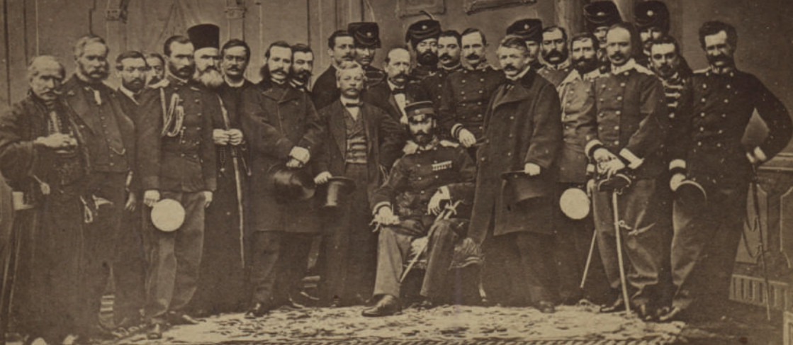
Српска делегација предвођена кнезом Михаилом у Цариграду