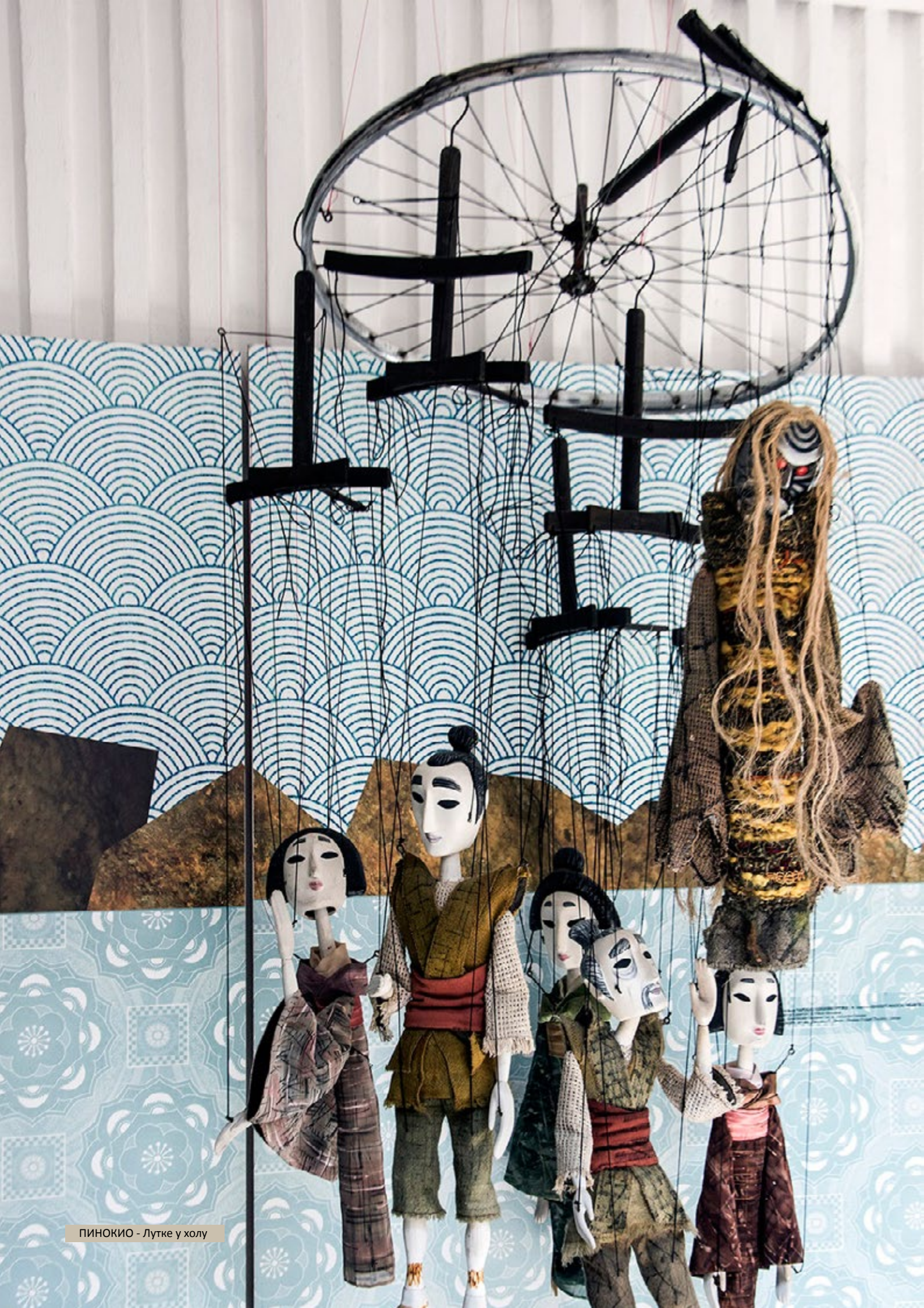
ПИНОКИО - Лутке у холу