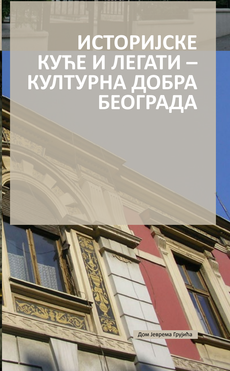
Дом Јеврема Грујића