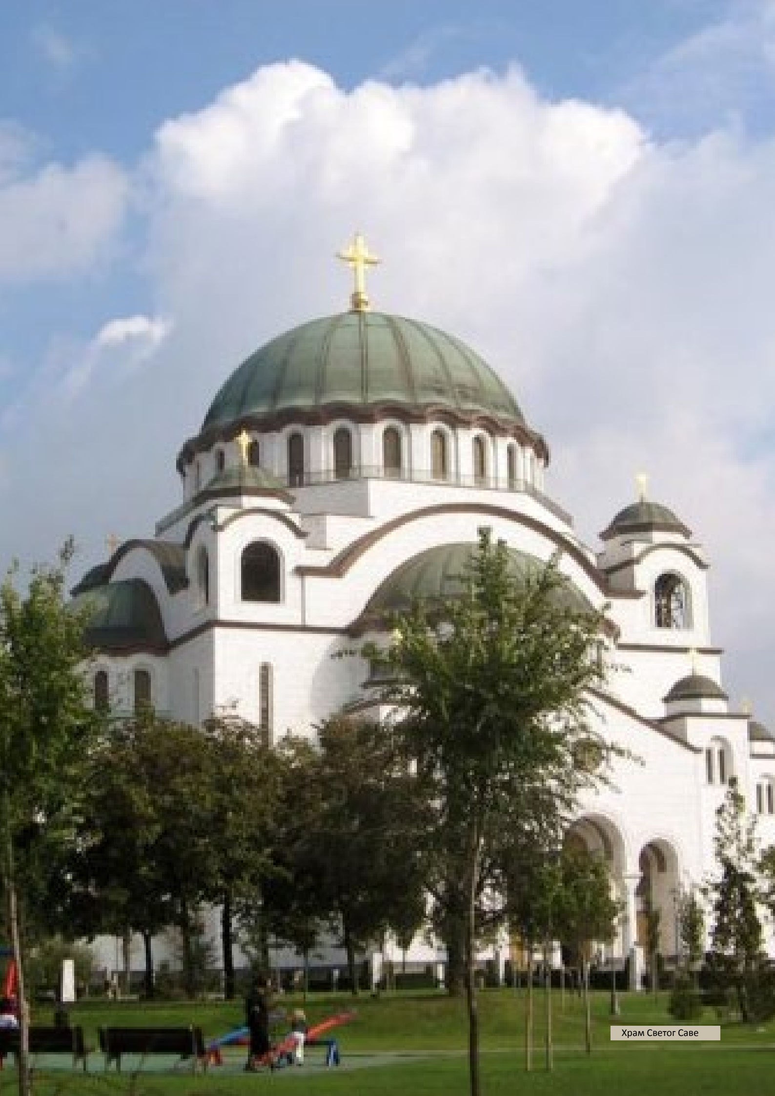
Храм Светог Саве