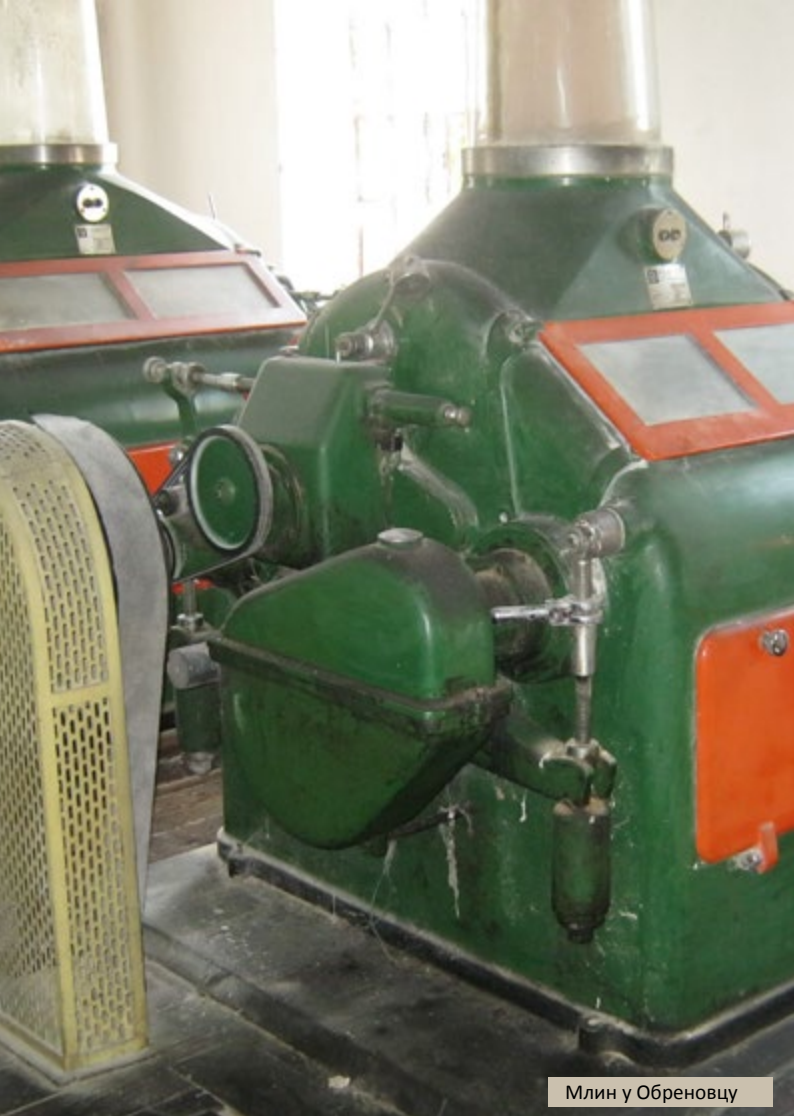
Млин у Обреновцу